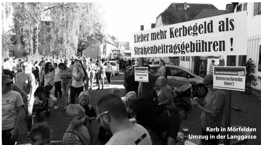
Kerb in Mörfelden Umzug in der Langgasse

„Wer kämpft, kann verlieren - wer nicht kämpft, hat schon verloren!“