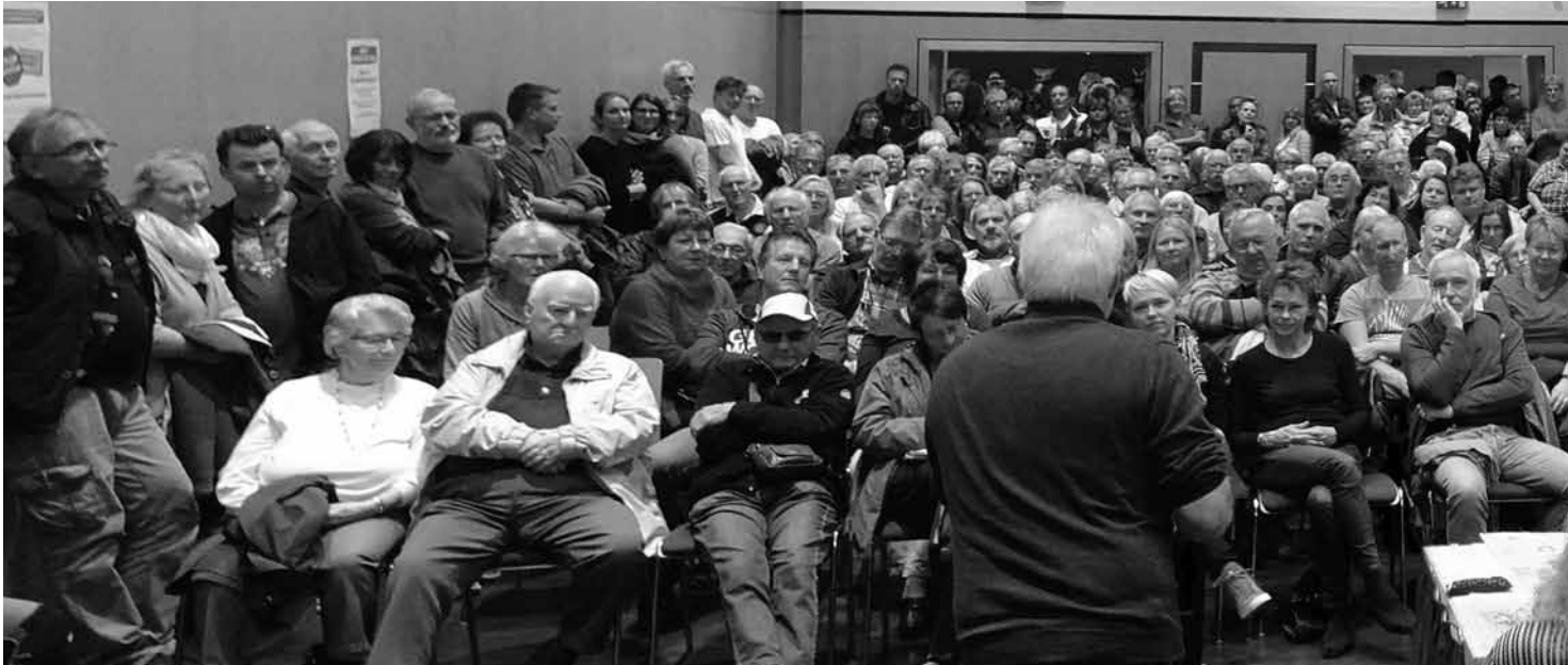
Der Widerstand wird stärker. Eine Versammlung gegen die Straßenbeiträge im Bürgerhaus mit Diskussionen, in denen die Ablehnung dieser Pläne deutlich ausgesprochen wird. Wir empfehlen