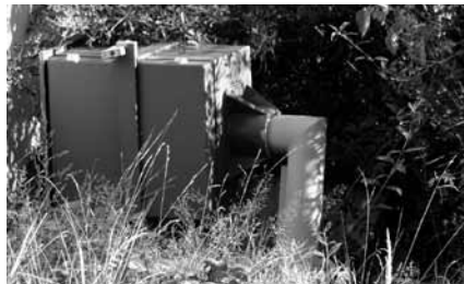
Was ist denn hier zugewachsen?

Wir wollten an den Trauerhallen zwei Gedenktafeln für die Euthanasie-Opfer unserer Stadt. Abgelehnt! Wir werden darauf zurückkommen.