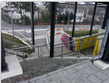
Ungesicherte Stelle (Stockhausenstraße)