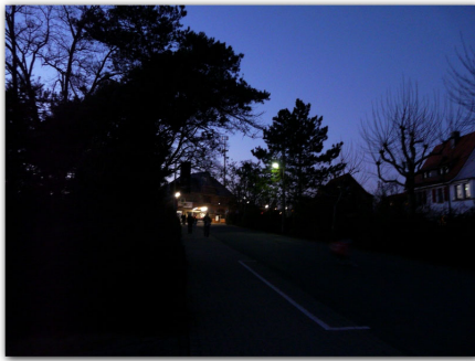
Bahnhofstraße zu wenig Lampen