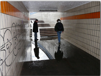
Wasser in der Unterführung