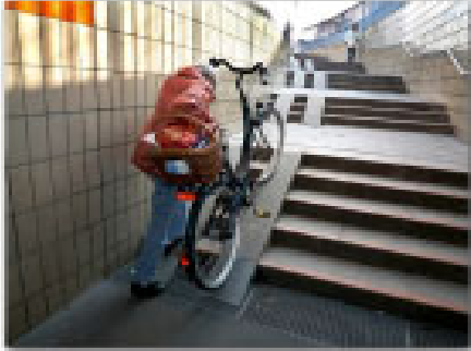
Für Fahrräder zu steil