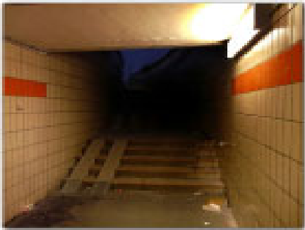
Schlecht beleuchtete Unterführung