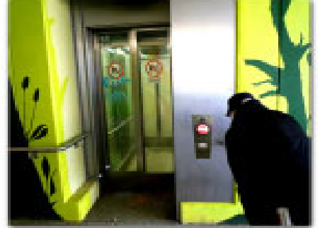
Aufzug ständig „außer Betrieb“