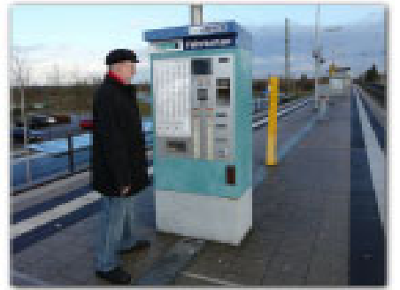
Fahrkartenautomat ohne Regenschutz